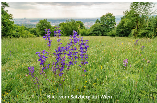
Blick vom Satzberg auf Wien

In den westlichsten Teilen Wiens im Steinbachtal und um Hinterhainbach befinden sich mehrere Wiesen verstreut in der weitläufigen Waldlandschaft. Schon von der Größe her ragen hier die Flächen auf der Sophienalm und der Mostalm heraus. Am Wolfersberg und Kolbeterberg tragen Wiesen in enger Nachbarschaft zum Siedlungsgebiet besonders zur Lebensqualität bei. Noch näher Richtung Stadtzentrum liegen artenreiche Wiesen am Satzberg und in den Steinhofgründen. Einige Penzinger Wiesen zeichnen sich durch große, alte Obstbaumbestände aus. Neben der Mostalm und den Steinhofgründen gehört zum Beispiel auch eine Wiese im Dehnepark dazu.