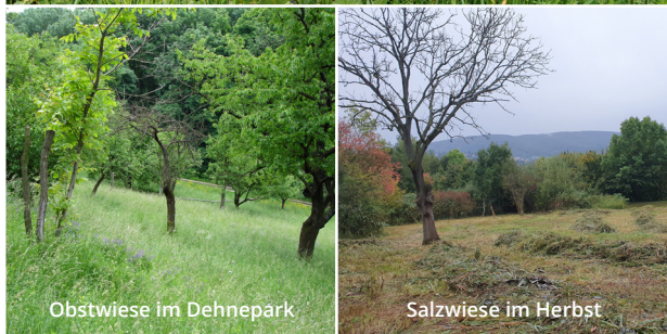
Obstwiese im Dehnepark